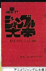
アニメ「ジャングル大帝」第1話脚本