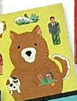
「迷犬ルパンの名推理」辻真先 光文社