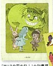
「アリスの国の殺人」大和書房