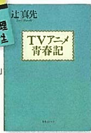
「TVアニメ青春記」実業之日本社