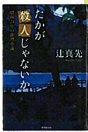
「たかが殺人じゃないか 昭和24年の推理小説」東京創元社