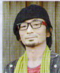
宮田 雄平 Miyata Yuhei フォトグラファー

名古屋市在住。 名古屋ビジュアルアーツ専門学校 写真学科を卒業後にフリーランスのカメラマンとなる。 雑誌や書籍、広告、ライブやイベントなどの撮影を行いながら、ライフワークであるスナップ撮影やワークショップの講師を行う。 写真撮影と街撮りコラムを執筆した「ナゴヤ愛 地元民も知らないスゴイ魅力」(秀和システム・刊)を出版。