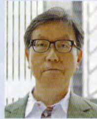
太田 忠司 Ota Tadashi 作家

1959年名古屋市生まれ。名古屋工業大学卒業。 1981年「帰郷」が星新一ショートショートコンテスト優秀作に選ばれ、1990年「僕の殺人」で長編デビュー。 2005年「黄金蝶ひとり」でうつのみやこども賞受賞。 2017年「名古屋駅西 喫茶ユトリロ」で日本と真ん中書店大賞第三位。著書は他に「新宿少年探偵団」「奇談蒐集家」「ミステリなふたり」「麻倉玲一は信頼できない語り手」他、多数。